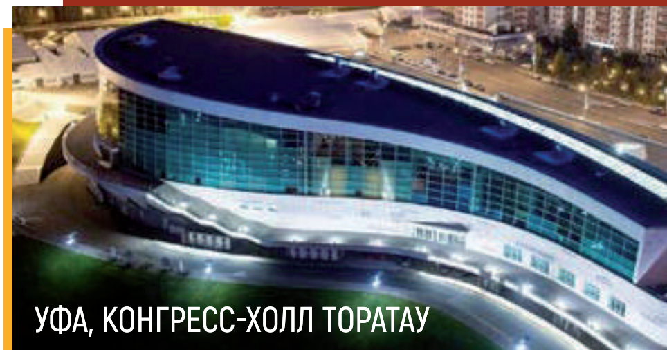
УФА, КОНГРЕСС-ХОЛЛ ТОРАТАУ